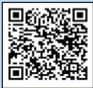
電子帳簿等保存制度特設サイト