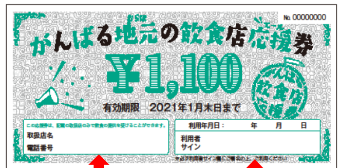
【法人事業者用利用券額面 1,100 円】